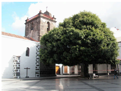
Pl. España, Iglesia N. S. de los Remedios