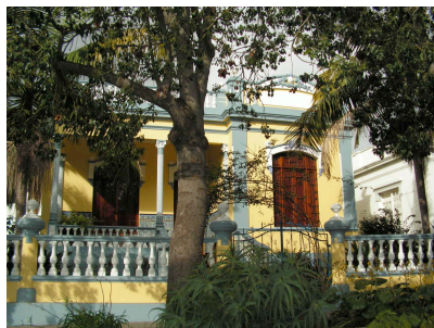
Jugendstilvilla Av. Doctor Fleming