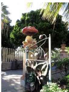
Tor zum Park