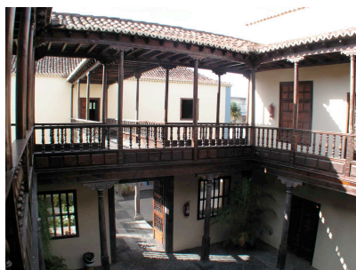
Casa Massieu - van Dale