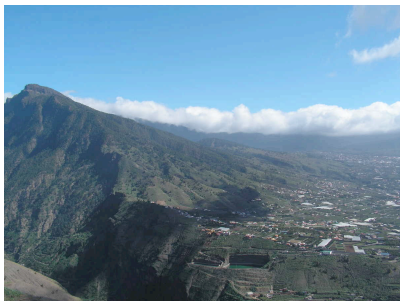
Blick in Bco. Angustias und auf Bejenado