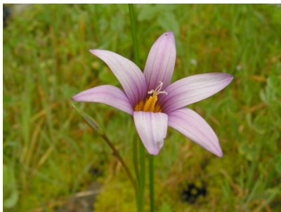
Romulea grandiscapa Kanaren-Scheinkrokus endemisch Kanaren, Madeira