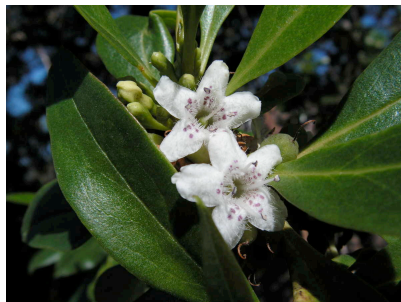
Myoporum tenuifolium Dünnblättrige Drüsenpflanze Herkunft: Australien