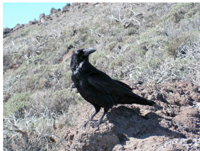
La Palma-Rabe Corvus corax tingitanus , Cuervo