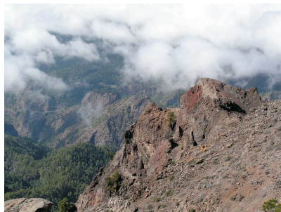
Blick auf Calderarand