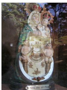
Ntra. Sra. del Pino