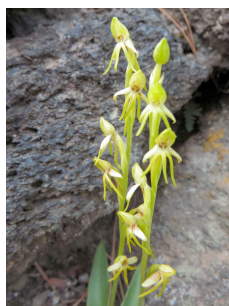
Habenaria tridactylites Kanarenstendel