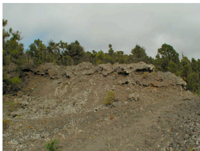
Lavafelder des Volcán Martín