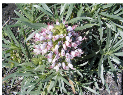
Echium brevirame Kurzästiger Nattertkopf