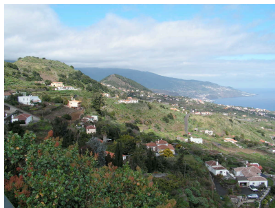
Blick über Küste ⇒ (Mazo, Breña Alta, Santa Cruz)