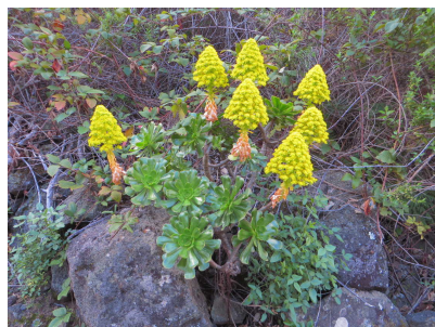
Aeonium holochrysum Goldgelbes Aeonium