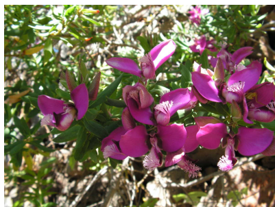
Polygala x dalmaisiana