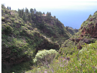
Barrancos mit typischer Vegetation